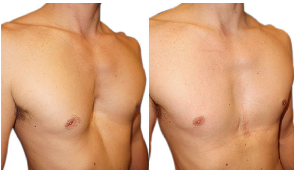
Résultat avant/après chez un homme

Il faut un an pour juger de la bonne maturation cicatricielle et de sa discrétion.