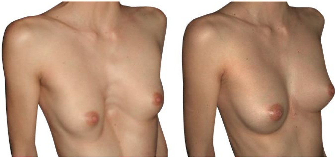
Résultat avant/après chez une femme

Les techniques modernes de reconstruction assistée par ordinateur ont encore amélioré les résultats esthétiques et cela surtout dans les formes très profondes et/ou asymétriques, en particulier chez la femme. La correction de la malformation est dans une grande majorité des cas totale, définitive et naturelle avec une restauration anatomique très satisfaisante.